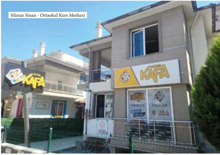
Mimar Sinan - Ortaokul Kurs Merkezi