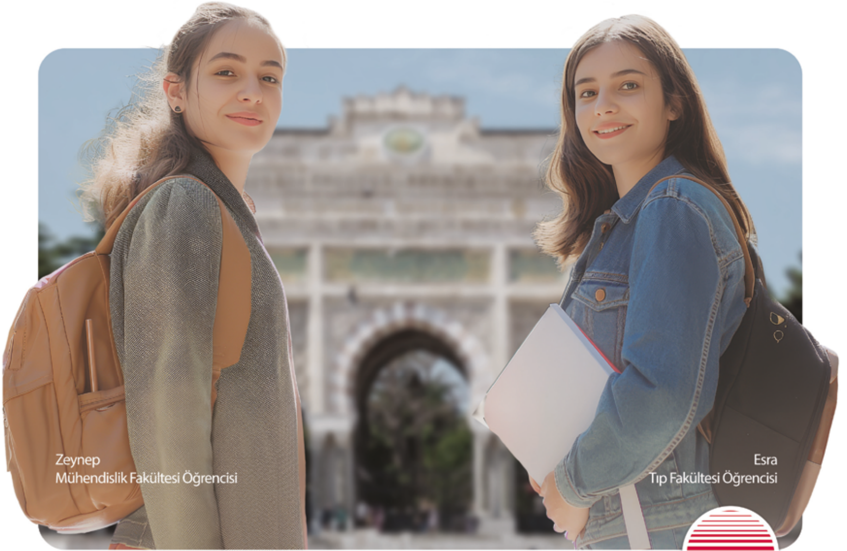
Zeynep Mühendislik Fakültesi Öğrencisi