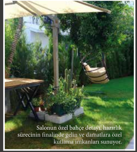
Salonun özel bahçe detayı, hazırlık sürecinin finalinde gelin ve damatlara özel kutlama imkanları sunuyor.

Salonun özel bahçe detayı, hazırlık sürecinin finalinde gelin ve damatlarla özel kutlama imkanları sunuyor.