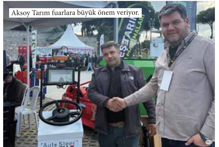
Aksoy Tarım fuarlara büyük önem veriyor.