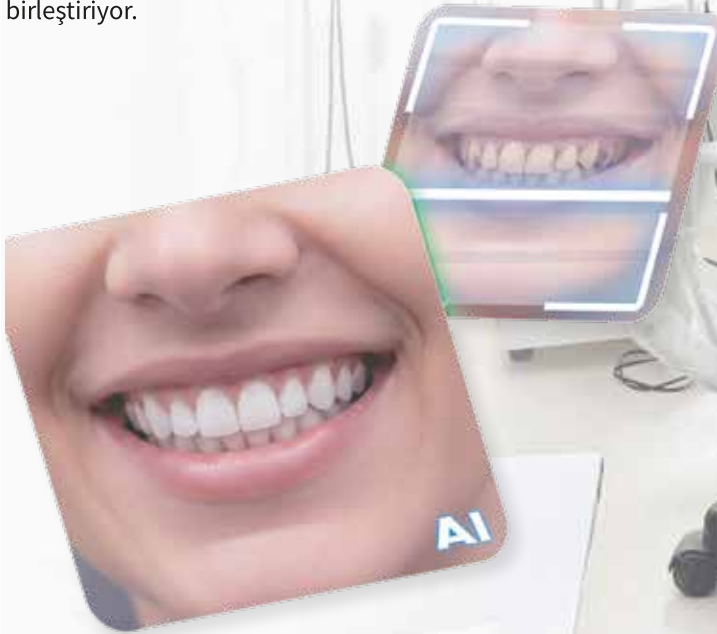
Samet Arda Altınyürek

BioSmile Ağız ve Diş Sağlığı Polikliniği